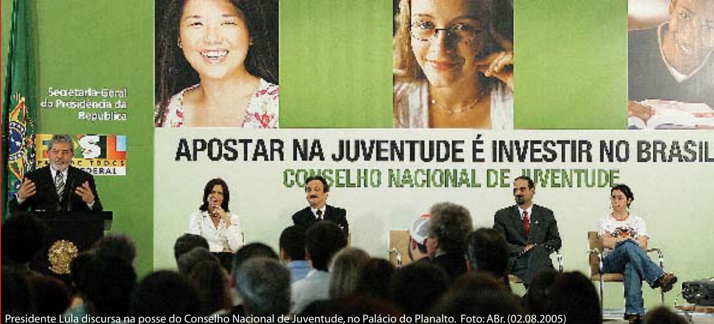
Presidente Lula discursa na posse do Conselho Nacional de Juventude, no Palácio do Planalto. (02.08.2005)